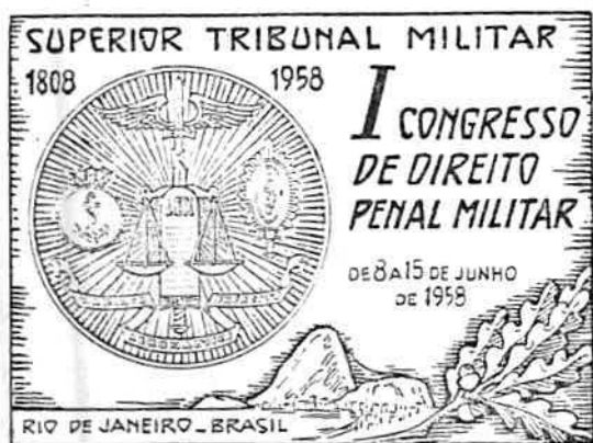
Plaqueta comemorativa do Congresso, distribuída aos Congressistas